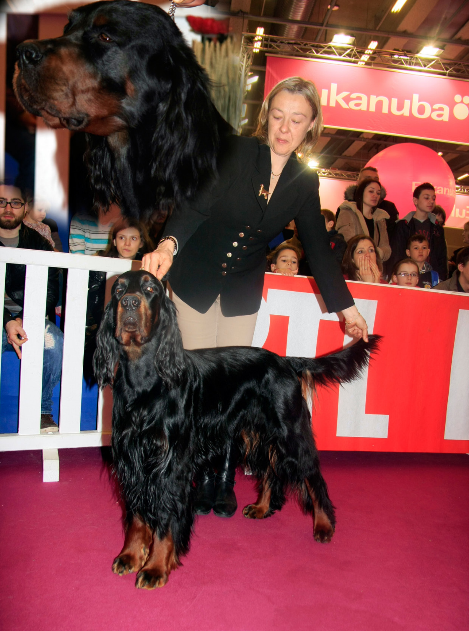
Meilleur chien en classe travail : Darius de Cinq à Sept