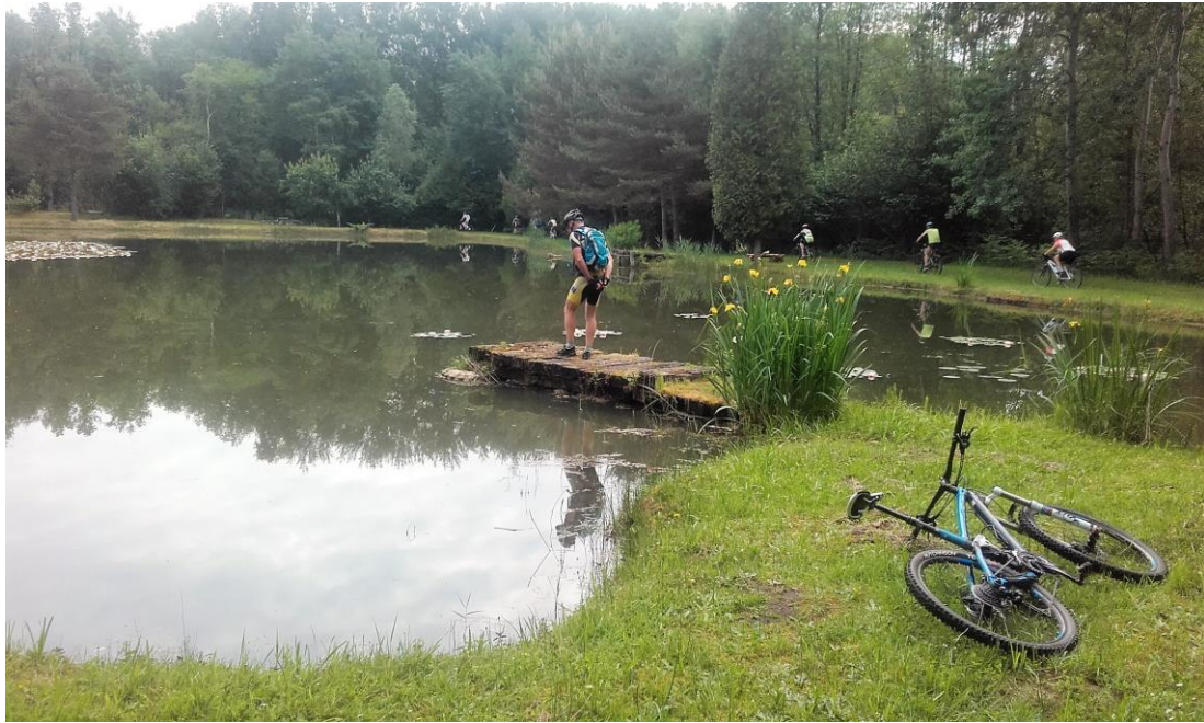
Ah oui, on passe par l'étang des bambous