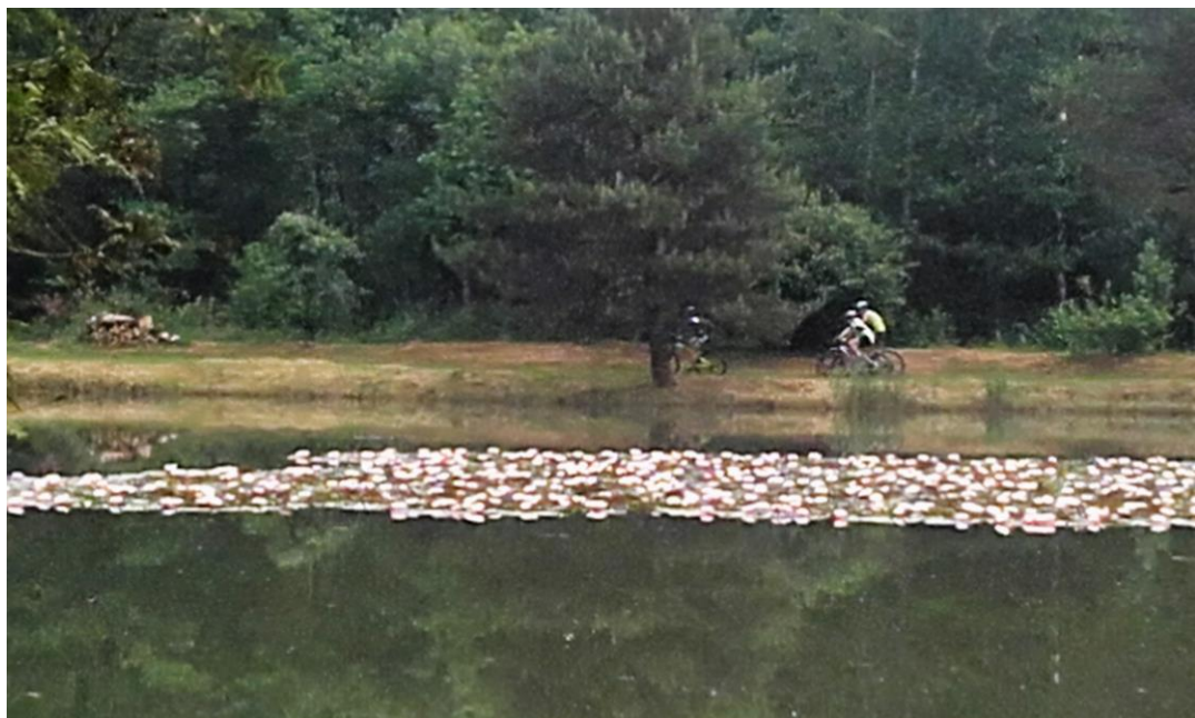
Magnifique le parterre de nénuphars Les cyclistes font le tour du « lac »