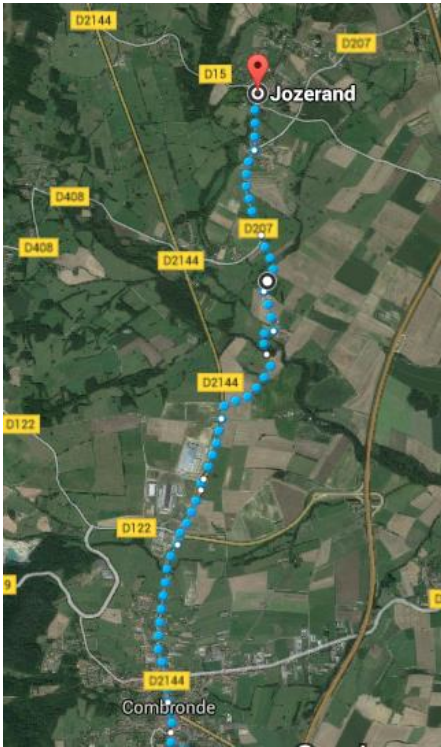
Jozerand à Combronde, 5 km 500