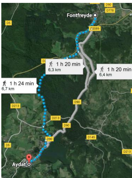
Fontfreyde à Aydat, via Route du Lac 6 km 300