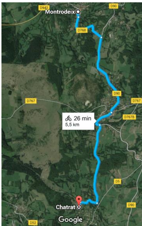
Montrodeix à Chatrat, Saint Geniès Champanelle, 5,5 km