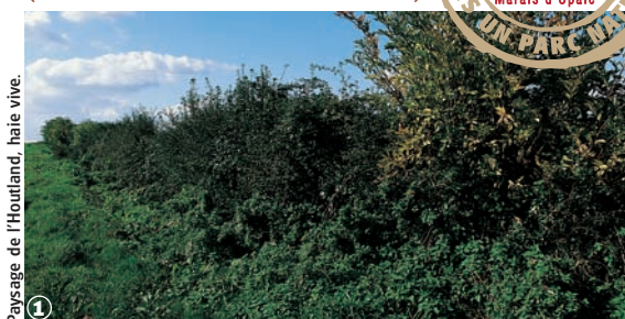
Paysage de l'Houtland, haie vive.

Randonnée Pédestre Du Bocage au Marais : 14 km