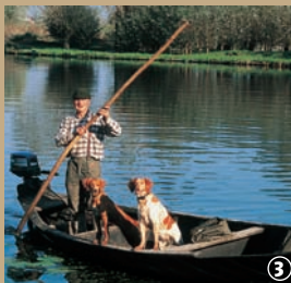
Marais de Nieurllet.

Frontière entre le Nord et le Pas-de-Calais, le marais audomarois trouve son origine à l'époque Gallo-romaine. La mer s'engouffrait alors jusqu'à Watten et Saint-Omer était un port actif. Suite à l'érosion et aux changements climatiques, la mer s'est retirée et Watten culmine à 72 m d'altitude. De ce point, s'étendent à perte de