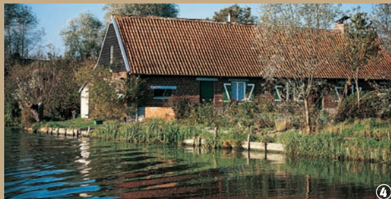
Marais de Nieurllet. Habitat traditionnel.