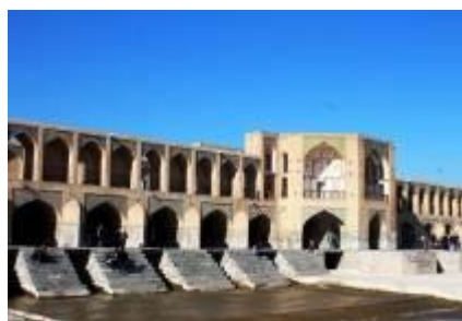
Le pont Kadju