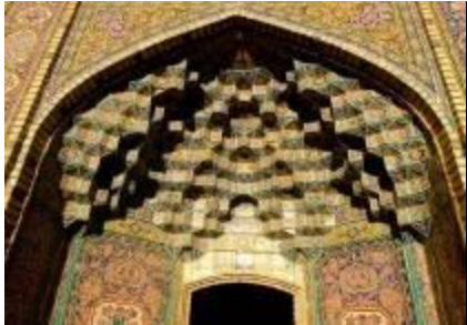
Mosquée Nasir Al Molk