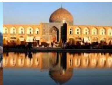
La mosquée Lotfollah