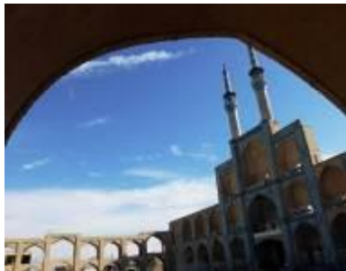
Place Amir Tchamaq