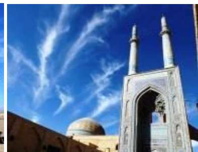
Mosquée du Vendredi