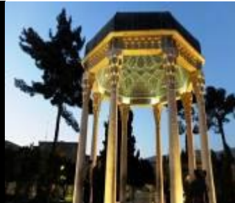
Tombeau de Hafez