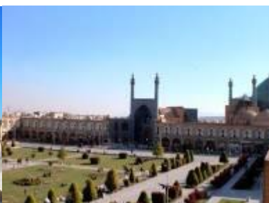
La place royale