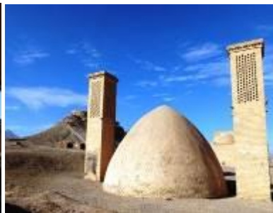
Tours du vent et du silence