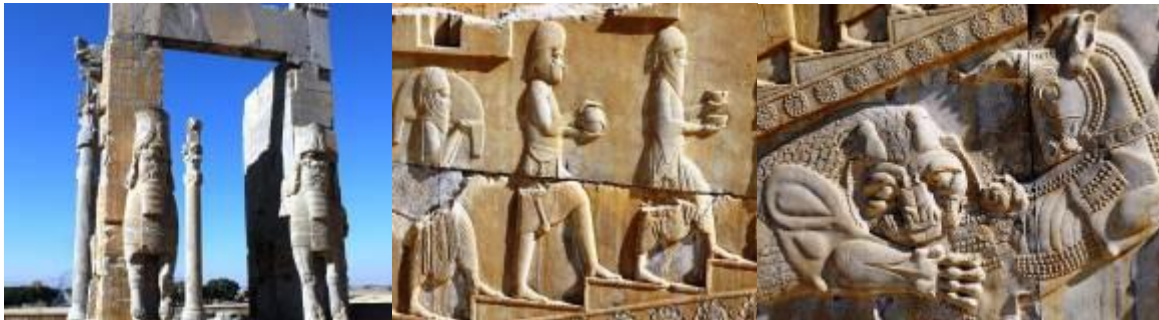
Porte des Nations

L'ensemble reste empreint d'une grandeur majestueuse avec son escalier monumental de cent onze marches, la colossale porte des Nations avec les sculptures géantes des taureaux ailés à tête humaine et les futs élancés des colonnes de l'Apadana. Un des bijoux de Persépolis est l'étonnante frise des bas-reliefs de l'escalier de l'Apadana, qui représente sur une trentaine de mètres la procession des émissaires des 32 peuples de l'empire achéménide, venant payer tribut au Roi des Rois.