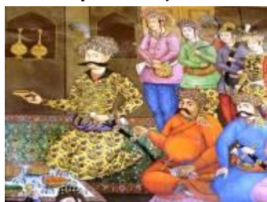
Peinture Palais 40 colonnes