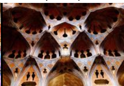
Salon de musique Ali Qapu