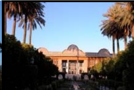
Jardin de l'orangerie