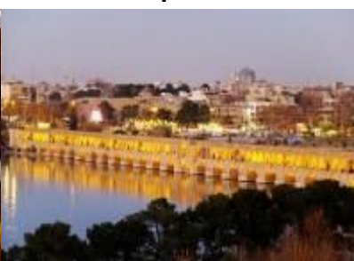
Pont aux 33 arches