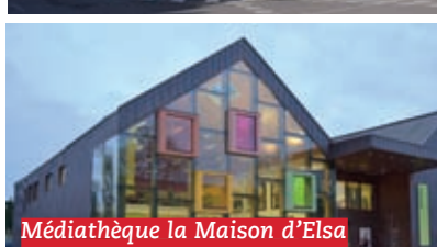
Médiathèque la Maison d'Elsa

Construction de la Maison d'Elsa (médiathèque et théâtre) et aménagement de ses abords