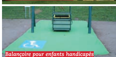
Balanoire pour enfants handicapés

Elaboration d'une charte Commune-Handicap pour favoriser l'accessibilité de la ville à tous et promouvoir l'insertion dans la cité de toutes les personnes handicapées