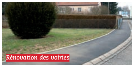
Rénovation des voiries

2,2 millions d'euros investis dans la rénovation des voiries des quartiers de Jarny