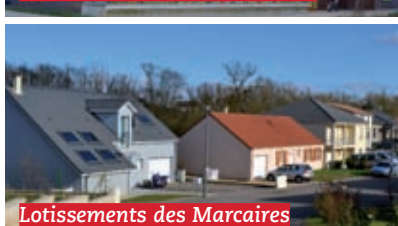
Lotissements des Marcaires

Aménagement des lotissements des Marcaires I et II (60 logements locatifs et 38 maisons individuelles) réhabilitation des 117 logements de cités du Grand Breuil et construction de 15 maisons individuelles par l'Immobilier des Chemins de Fer