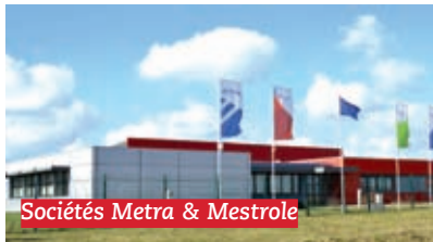
Sociétés Metra & Mestrole

Développement de la Z.I de Jarny-Giraumont avec plus de 180 emplois industriels. Aucune entreprise n'y était implantée en 2001. Aujourd'hui, Jarny compte 415 entreprises soit + 30 % par rapport à 2009 (sources: CCI de Nancy et Chambre des Métiers de Briey)