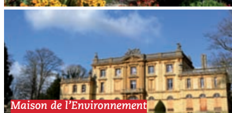
Maison de l'Environnement

Aménagement d'une Maison de l'Environnement au château de Moncel où 8 associations environnementales sont hébergées