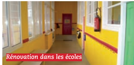
Rénovation dans les écoles

Un plan de rénovation des écoles de 1,4 millions d'euros et lancement d'un grand plan d'informatisation de tous les établissements scolaires