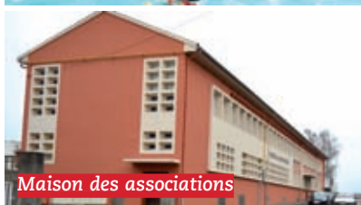
Maison des associations

Aménagement d'une Maison des Associations dans l'ancien lycée Anne Frank qui accueille 16 associations sur 1 800 m 2