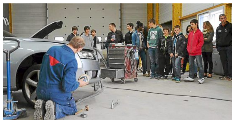
Les collégiens des classes de 4 e de Saint-Varent ont visité la carrosserie Lemer.

Depuis quelques années maintenant, la Maison de l'emploi et de la formation du Thouarsais invite les collégiens du territoire à découvrir différents métiers en organisant des visites d'entreprises. Finies les conversations très théoriques avec des professionnels autour d'une table : grâce à cette nouvelle formule, les adolescents peuvent se faire une idée très précise des conditions de travail dans telle ou telle filière. Ce forum avait lieu jeudi. Huit entreprises du Thouarsais ont joué le jeu en accueillant, en tout, près de 400 élèves de 4 e des collèges du secteur (Thouars, Saint-Varent, Bouillé-Loretz...). C'était le cas de la carrosserie Lemer, société familiale qui fête cette année ses trente ans d'existence. Avec six salariés et deux apprentis, ce garage dirigé par Freddy