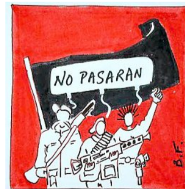
Chaque chapitre est illustré.

« Chroniques noires à Thouars », paru chez Geste Edition, collection LeGesteNoir, prix : 13,90 €. Blog : http://sapristibalthazar.over-blog.com/