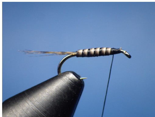
3. Enrouler le quill de paon. Couper l'excédent .