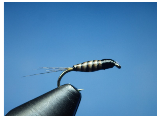
4. Former une tête/thorax à l'aide du fil de montage. Nœud final. Passer une fine couche de vernis UV et le durcir à l'aide de la lampe. Passer ensuite une fine de couche de vernis classique. Nymphé terminée.