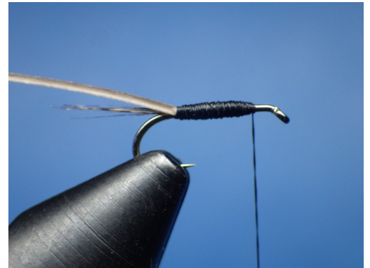
2. Fixer le quill de paon ébarbé et former un corps à l'aide du fil de montage.