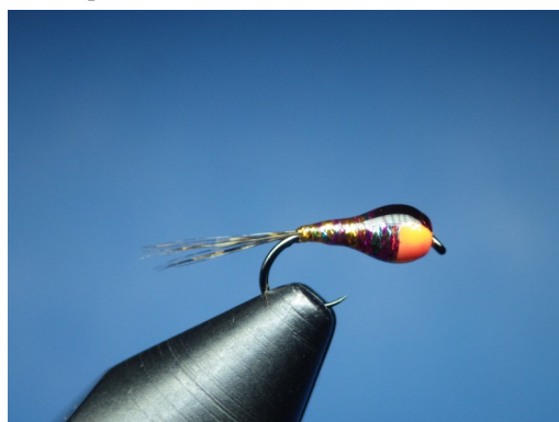
5. Appliquer en finition une couche de vernis classique. Laisser sécher. Mouche terminée.