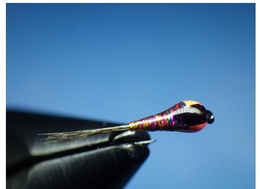
4. Appliquer de nouveau du vernis uniquement sur le trait noir. Le durcir à l'aide de la lampe adéquat.