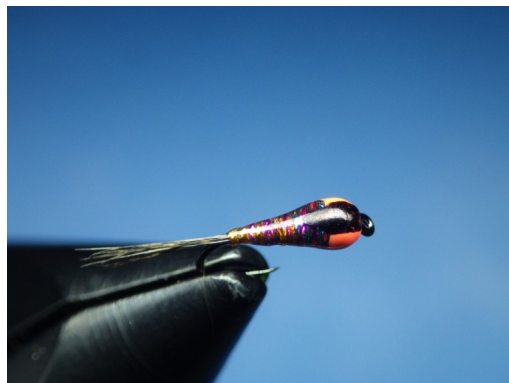
3. Mettre une fine couche de vernis U.V. et le durcir à l'aide de la lampe adéquat. Passer ensuite un fin trait de marqueur noir comme sur la photo.