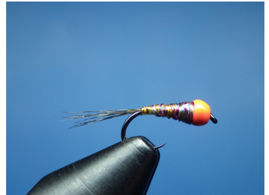
2. Commencer l'enroulement du fil iridescent et fixer les fibres de coq pardo à la courbure pour figurer les cerques. Former un corps do-du comme sur la photo. Nœud final.