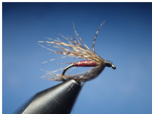
5. S'aider éventuellement du fil de montage pour accentuer l'inclinaison des fibres. Nœud final. Mouche terminée.