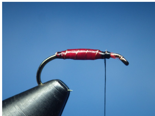
3. Choisir à ce stade de vernir (ou non) le corps à l'aide du vernis U.V.. Ici, le corps est verni.