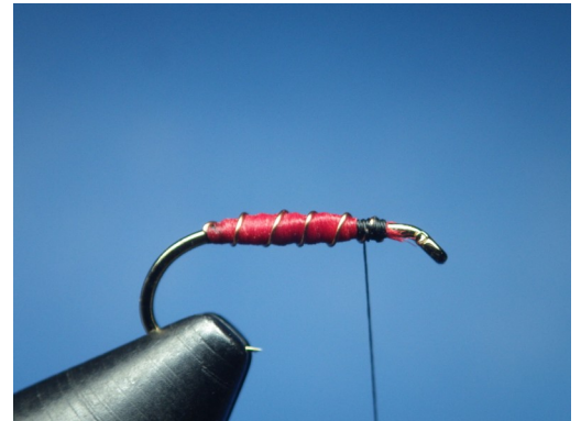
2. Fixer en suite un brin de Uni 3/0 rouge et l'enrouler par une succession d'aller/retour afin de former un corps dodu. Bloquer le brin de Uni 3/0 et cercler avec le cuivre.