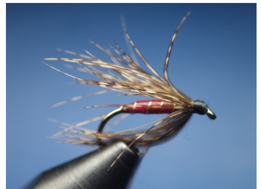
4. Enlever tout le duvet de la plume de perdrix et la fixer par le pied. L'enrouler sur 2 ou 3 tours en prenant soin de rabattre les fibres à chaque enroulements.