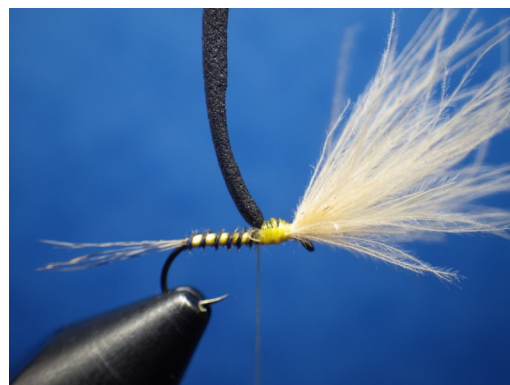
4. Fixer une bonne pincée de CDC pointe vers l'œillet et une bandelette de foam au niveau du herl qui va servir à diviser l'aile.