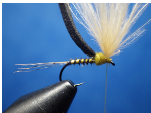
5. Faire adhérer une fine mèche de dubbing microfin et l'enrouler de manière à figurer le thorax. S'aider ensuite du fil de montage pour redresser l'aile.