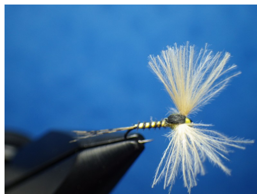
6. Rabattre la bandelette de foam entre les fibres de CDC de manière à obtenir 2 ailes de même volume. Fixer la bandelette et faire la tête en fil de montage. Nœud final. Tailler les ailes à la bonne dimension. Mouche terminée.