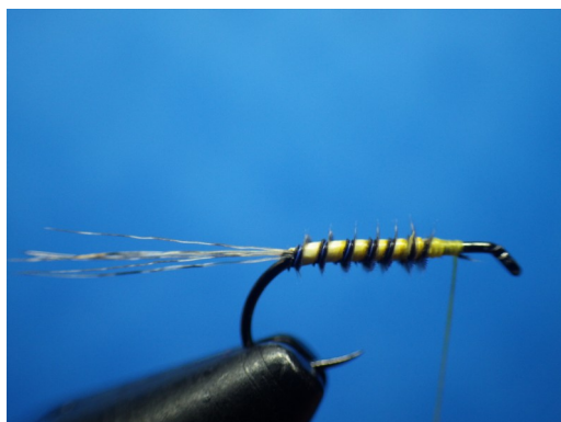
3. Une fois le herl enrouler, amener le fil au milieu du thorax.