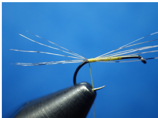
1. Amener le fil de montage à la courbure et fixer une petite pincée de pardo pour figurer les cerques.