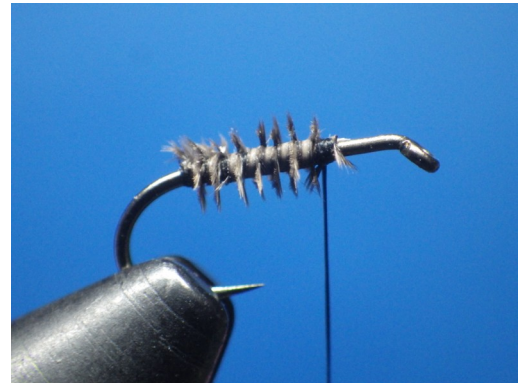
2. Enrouler ce herl jusqu'au point de fixation des plumes de flanc de canne.