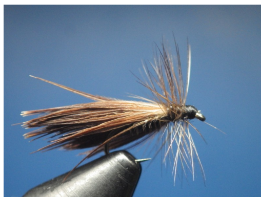
5. Enrouler le hackle sur 3 ou 4 tours seulement. Le fixer, couper l'excédent de plume et faire la tête. Nœud final. Mouche terminée.