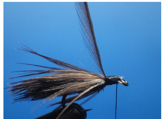
4. Fixer le hackle de cou de coq.