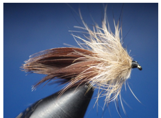
6. Une variante avec collerette en poils clair de masque de lièvre.