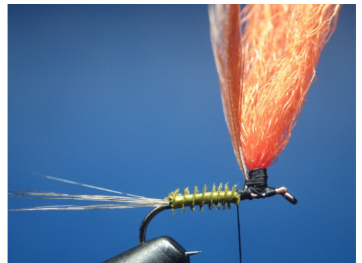
4. Fixer le hackle à la base de la mèche de para-post l'attacher à la base de celle-ci par quelques enroulements horizontaux. Ramener le fil au point d'arrêt du herl.