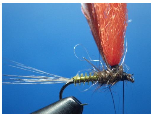
5. Faire adhérer un léger dubbing de lièvre/antron et former le thorax. Mettre le fil en attente au niveau de la tête de la mouche.