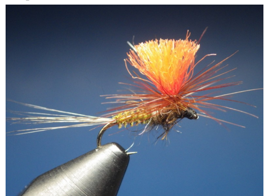
6. Enrouler le hackle de manière horizontale sur 3 ou 4 tours et venir le bloquer au niveau de la tête. Couper l'excédent et effectuer la tête de la mouche et le nœud final. Mouche terminée.