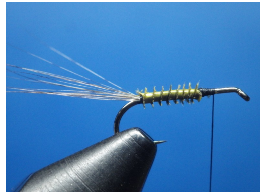
2. Fixer le herl de substitut de condor et l'enrouler jusqu'au niveau du thorax.