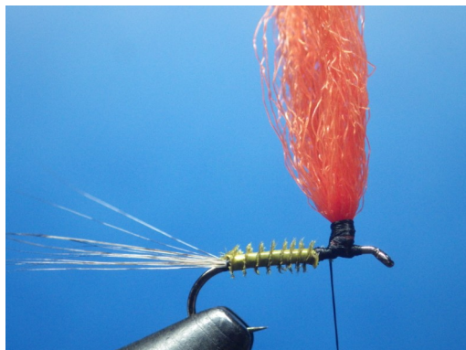
3. Fixer en la doublant une mèche de para-post. Effectuer des enroulements horizontaux à la base de la mèche pour faciliter l'enroulement du hackle.