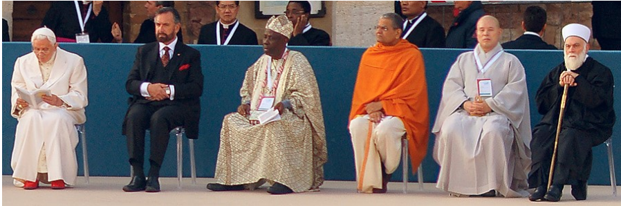
A gauche, l'antipape Ratzinger aux rencontres d'Assise du 27/10/2011

leurs erreurs dogmatiques et morales. Il n'y a pas de solide et de véritable amitié hors de Jésus-Christ.