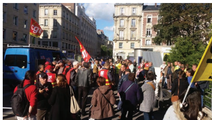
Rassemblement à Rouen.

Les libertés syndicales ne sont pas négociables, elles sont déterminantes pour l'obtention de nouvelles conquêtes sociales, c'est dans ce sens que ces questions doivent être portées avec force lors notre journée d'action et de mobilisation unitaire de 8 octobre.