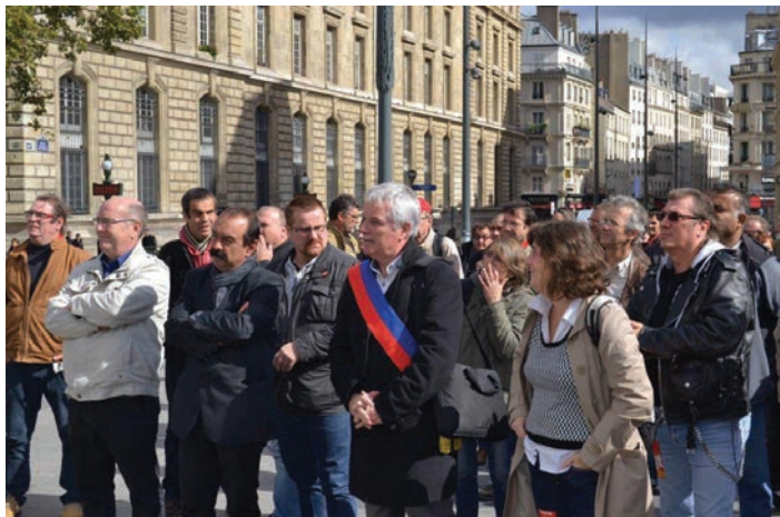
Rassemblement Place de la République à Paris.