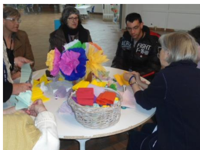
« Temps des Fleurs »

Atelier Sciences et Techniques, seulement mercredi et jeudi. Venez le découvrir !