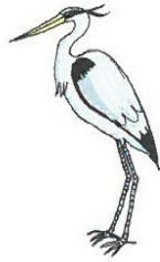
un h éron