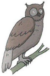
un h ibou