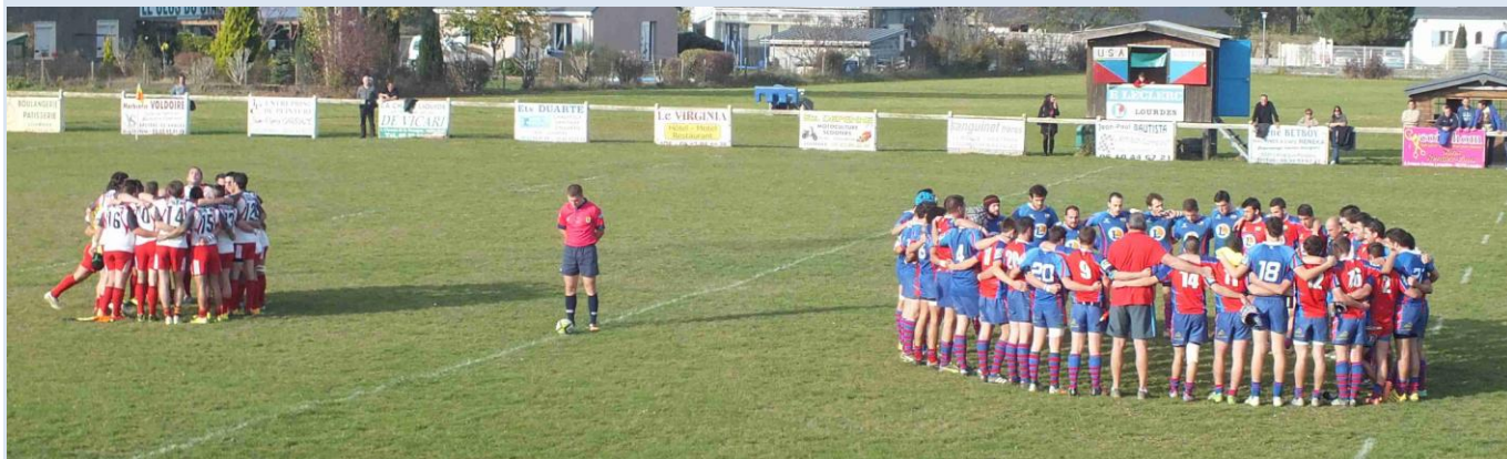
E1 : Minute de silence avant le coup d'envoi !