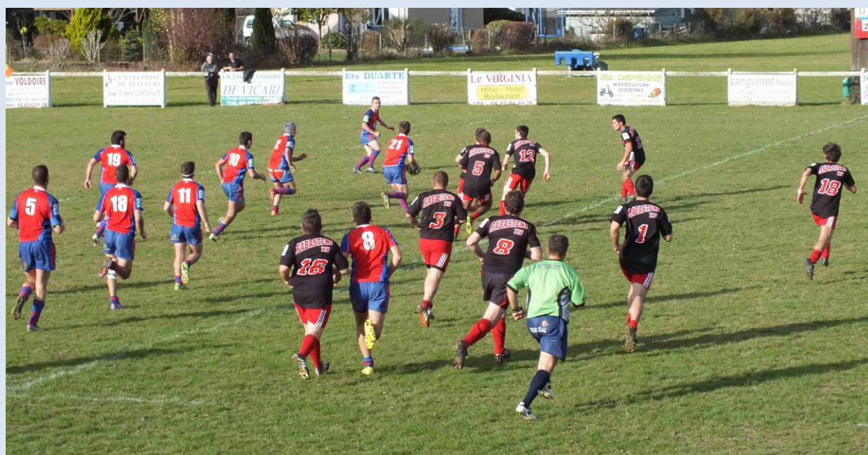
E2 : Bonne action collective !