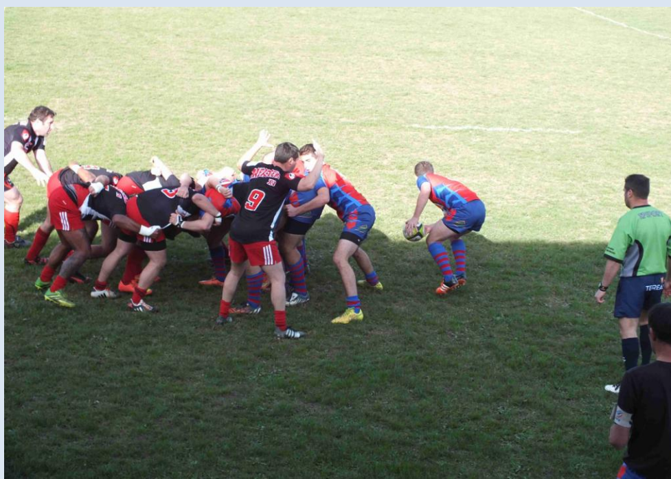
E2 : Belle intention !