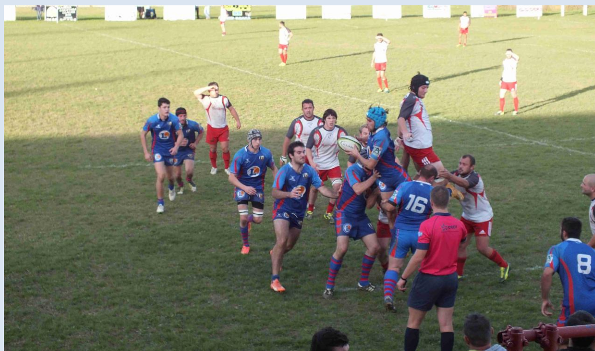
E1 : « A nous ! »