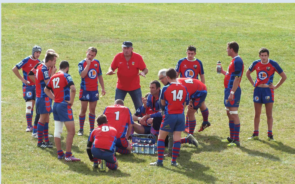
E2 : Tout le monde commence par apprendre !