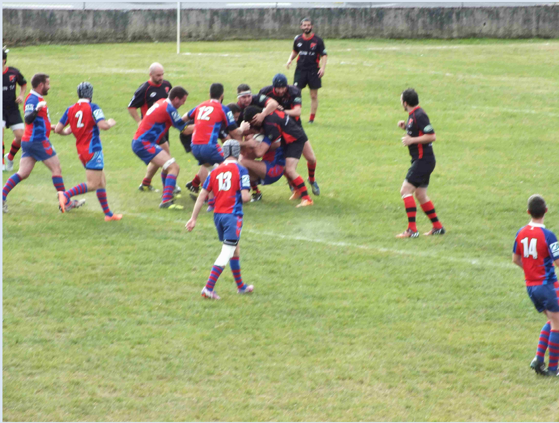
E2 : L'étai se resserre !