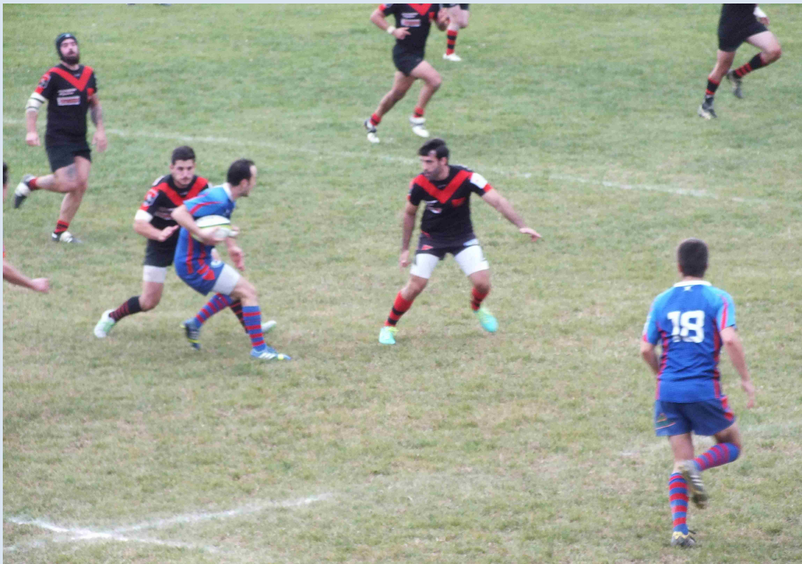
E1 : Vite, la passe !