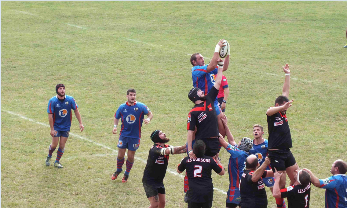
E1 : Et à deux mains !