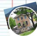
CM1-CM2 SLB @cm1_cm2_SLB