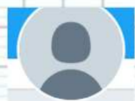
Ecole du Centre @classerby Vous suit