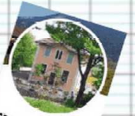
CM1-CM2 SLB @cm1_cm2_SLB

J'ai vu zéphyr, un kiwi fabuleux, et des coqs mages.