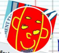
Ecole de Coatréven CM1-CM2 @0220797x

Le zébu, jaloux et moqueur, fait du yoga avec un whisky puant.