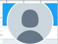
Ecole du Centre @classerby Vous suit