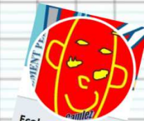
Ecole de Coatréven CM1-CM2 @0220797x

A Pâques, je fais le zouave à New York avec mon hibou et mes vieux doigts.