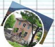
CM1-CM2 SLB @cm1_cm2_SLB

Bref, le joli coq et le vieux zéphyr mangent des kiwis.