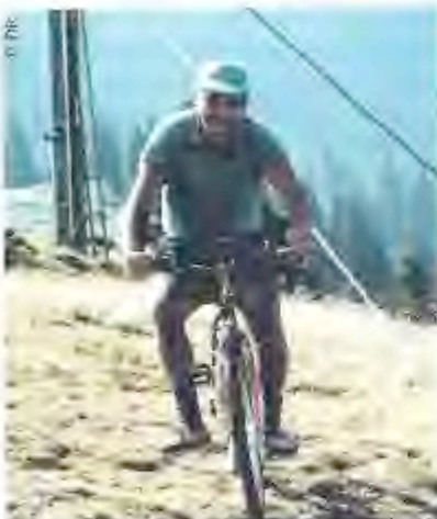
VTT en montagne

cette image des joueurs assis tranquillement en rond sur un coin de pelouse, savourant entre eux leur plaisir ! Je n'avais jamais vu cela... Si je devais m'inventer une occupation, poursuit-il, elle serait proche de ce que fait Lemerre : ingénieur en convivialité. Pour mettre la matière humaine dans une dynamique positive. »