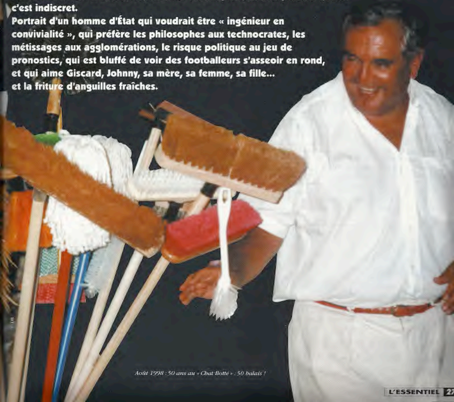
Août 1998 : 50 ans au « Chat Botté » - 50 balais !

Portrait d'un homme d'État qui voudrait être « ingénieur en convivialité », qui préfère les philosophes aux technocrates, les métissages aux agglomérations, le risque politique au jeu de pronostics, qui est bluffé de voir des footballeurs s'asseoir en rond, et qui aime Giscard, Johnny, sa mère, sa femme, sa fille... et la friture d'anguilles fraîches.