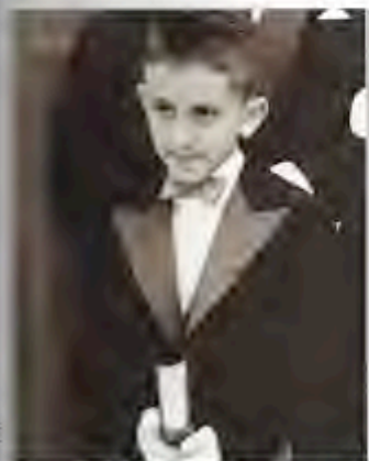
1 er smoking