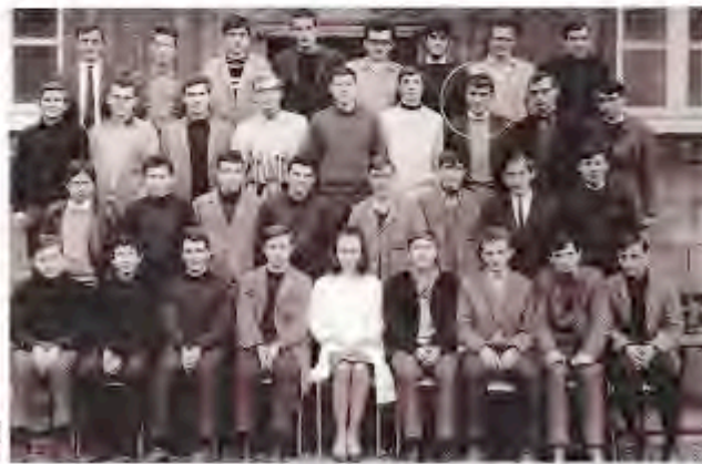
1966-67 au lycée d'État Henri IV à Poitiers