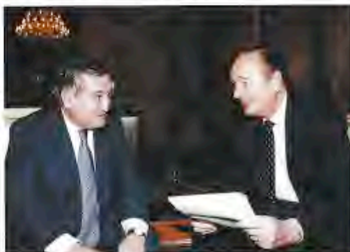
Le ministre des PME avec Chirac en février 1997

ses savoirs jusqu'à la clarté. Et de poursuivre : « Crépeau et Monory sont des gens de clarté, on n'a pas besoin de les voir toutes les cinq minutes pour savoir ce qu'ils pensent.