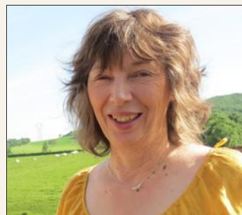
Catherine Gabrelle, 60 ans, maire de Royer, La République en marche