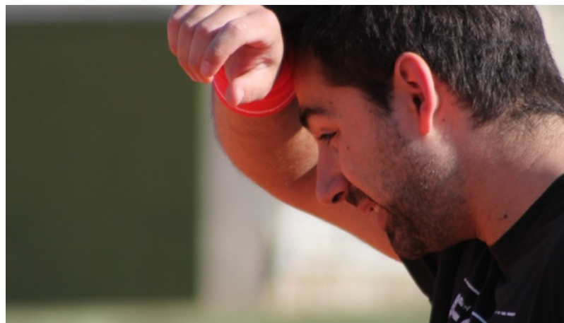
Gros coup chaud ce dimanche sur les rencontres par équipes qui se sont déroulées sous le soleil !