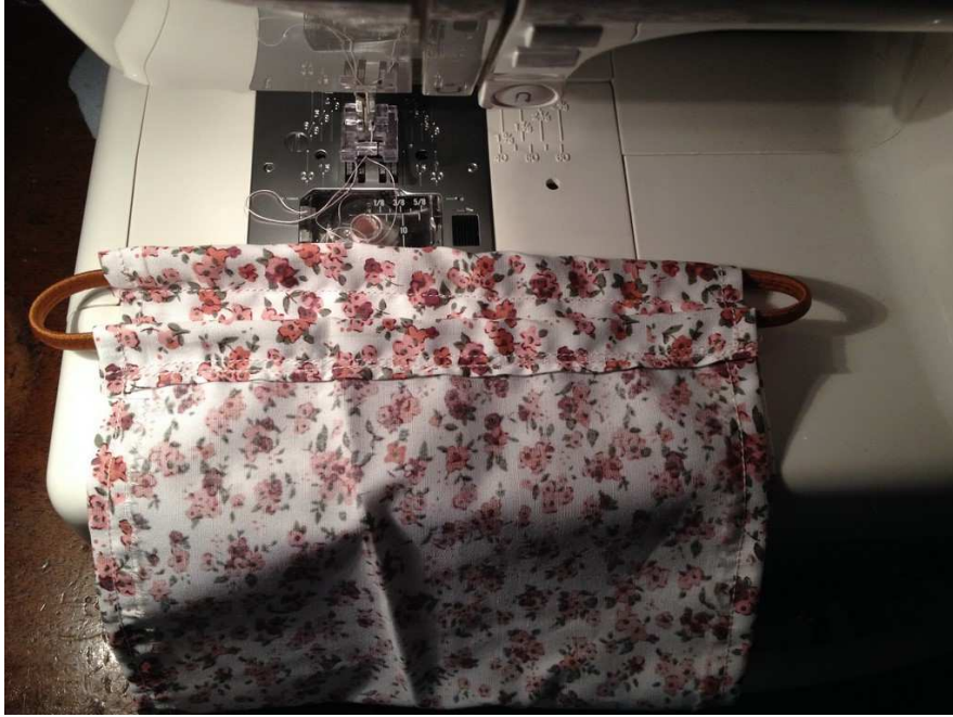
Résultat sur l'envers.