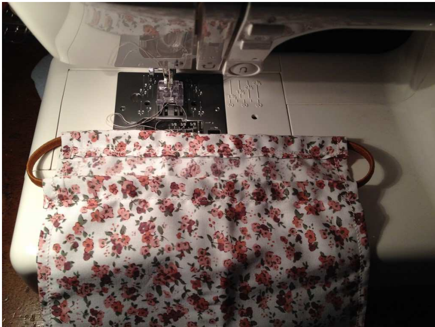
Résultat sur l'endroit.