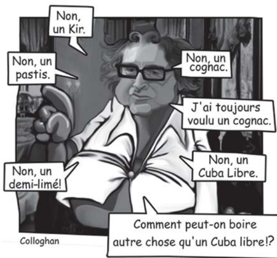
En 2007, et en trois mois, M. Onfray soutiendra S. Royal, O. Besancenot, J. Bové, l'abstention, puis, à nouveau Royal (dessin paru dans le journal d'AL