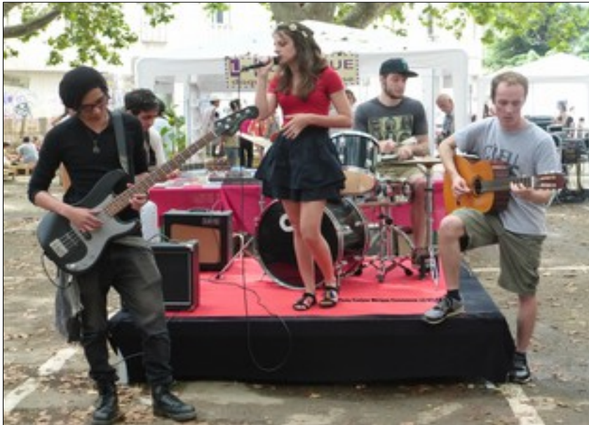
Le groupe Medication, le 12 juillet

Une scène, une sono, un public 20 minutes pour se faire découvrir !