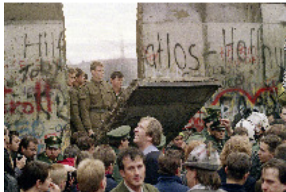
Chute du mur de Berlin 1989