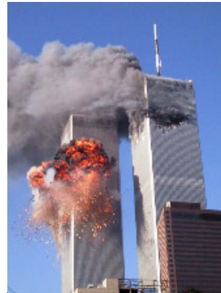
Attentats du 11/09 2001

Génocide de Srebrenica durant la guerre en Ex-Yougoslavie 1995