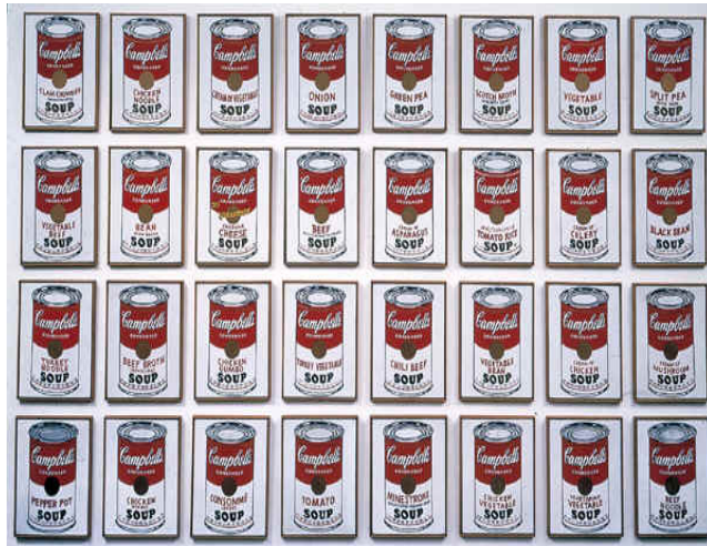
Andy Warhol Campbell's soup cans 1968

(V) « Ce que l'artiste dit être de l'art est de l'art ? » http://www.curiosphere.tv/video-documentaire/30-artetculture/103545-reportage-dejeuner-dun-peintre-new-yorkais-du-xxe-siecle