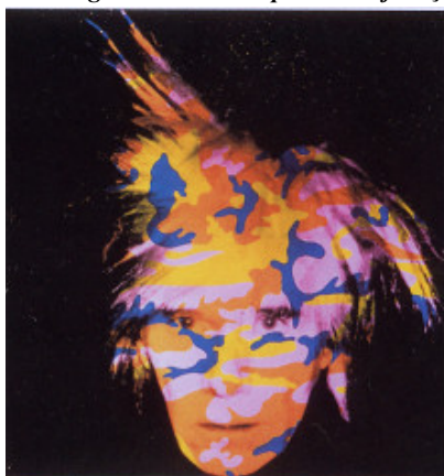
4) Andy Warhol (1930-1987), Autoportrait 9 (1986), acrylique sur toile, 203,5 x 203,7 cm (National Gallery of Victoria, Melbourne).

Le pop-Art : d'Andy Warhol à la ménagère de moins de 50 ans.