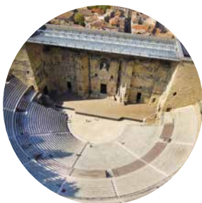
THÉÂTRE ANTIQUE D'ORANGE