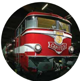
CITÉ DU TRAIN