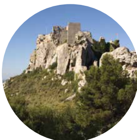
CHÂTEAU DES BAUX-DE-PROVENCE