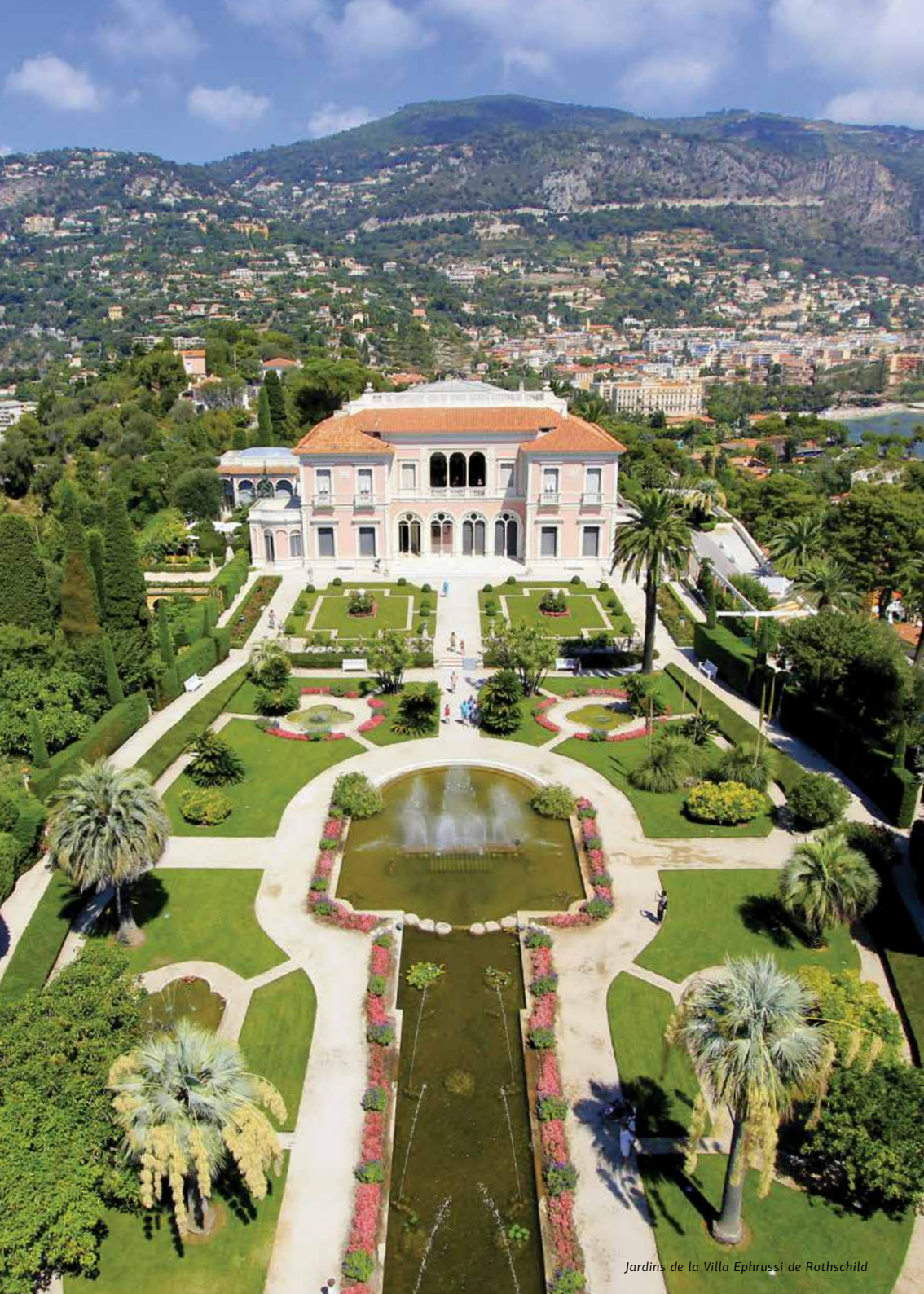
Jardins de la Villa Ephrussi de Rothschild