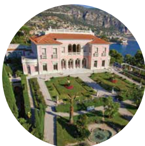
JARDINS DE LA VILLA EPHRUSSI DE RÖTHSCHILD

UN PROJET NATIONAL D'ACCESSIBILITÉ AU PATRIMOINE CULTUREL POUR LES JEUNES AUTISTES