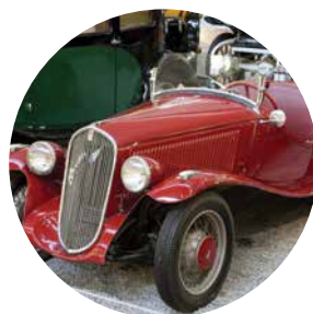
CITÉ DE L'AUTOMOBILE