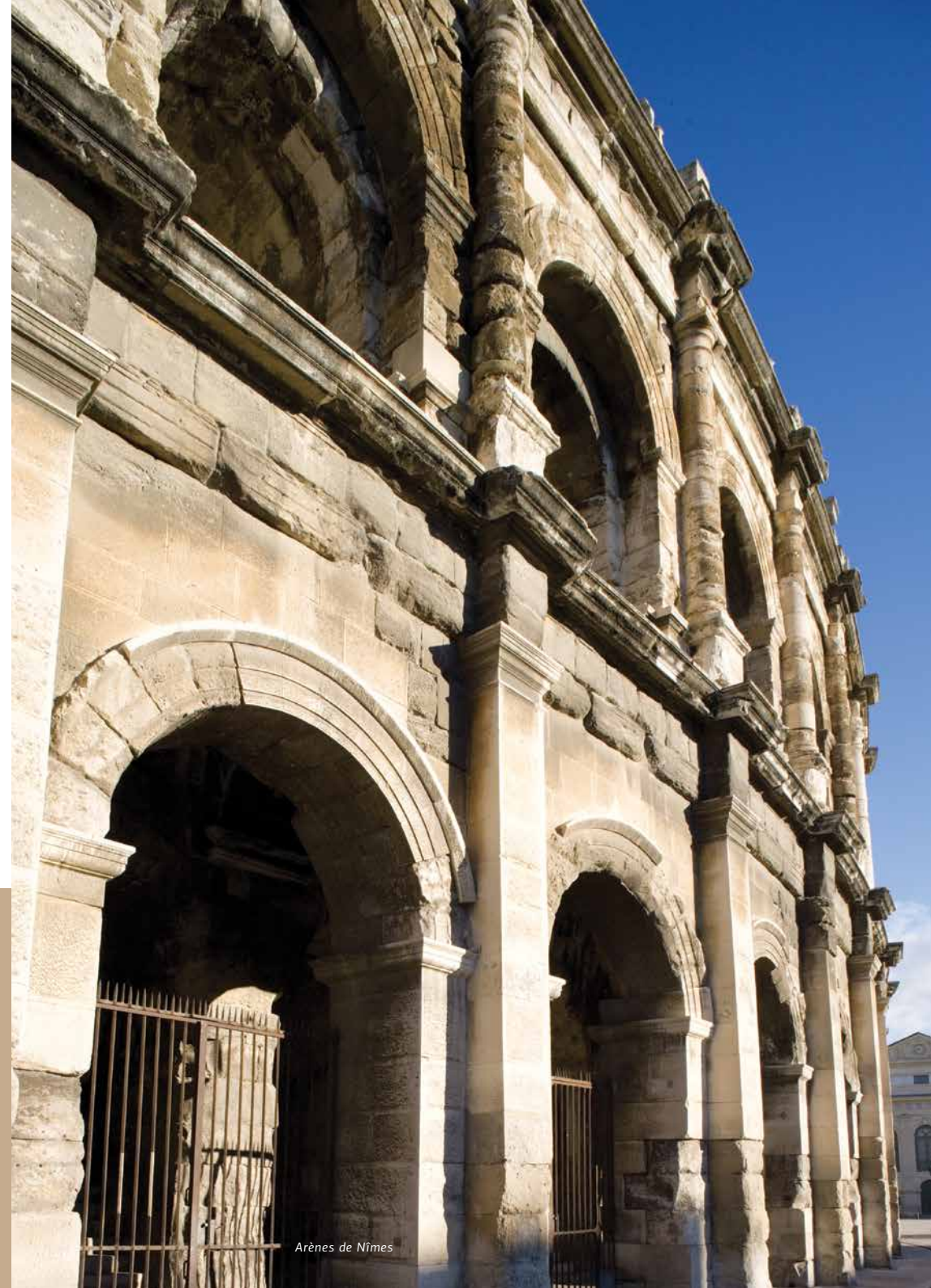
Arènes de Nîmes