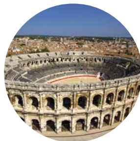
ARÈNES DE NÎMES