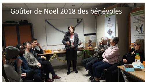
Goûter de Noël 2018 des bénévoles

Être bénévole c'est également contribuer à cette continuité historique des valeurs défendues par les aînés de la CLCV, en donnant de son temps, son inventivité et de son énergie. Rejoignez nous !!