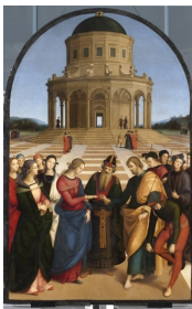
Le Mariage de la Vierge , Raphaël