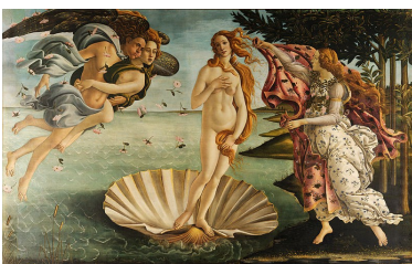
La Naissance de Vénus de Botticelli, réalisée en 1485.

La perspective est également largement investie dans la peinture. L'œuvre emblématique de cette tendance est La Naissance de Vénus de Botticelli, réalisée en 1485.