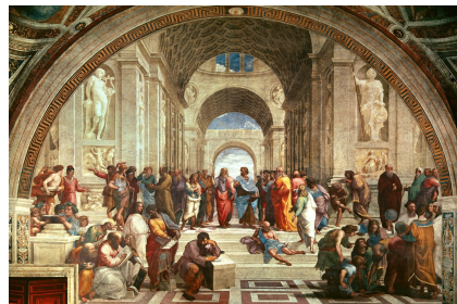
L'École d'Athènes , Raphaël