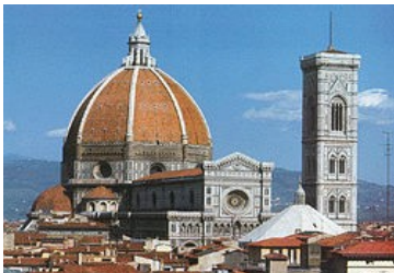
Santa Maria del Fiore, à Florence en Italie (Sainte Marie de la fleur)

L'emploi de la perspective technique permet notamment de réaliser de somptueux ouvrages architecturaux comme le dôme de la Santa Maria del Fiore , aux dimensions colossales.