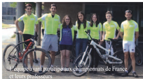
L'équipe ayant participé aux championnats de France et leurs professeurs

Les 26, 27 et 28 mai derniers ont eu lieu les championnats de France UNSS VTT à Gérardmer dans les Vosges.