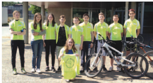
Les vttistes de l'association sportive du collège Cécile Sorel de Mériel sont fiers de vous présenter leurs nouvelles couleurs !