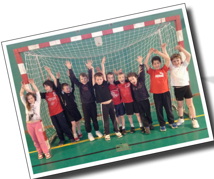
Équipe -9 ans