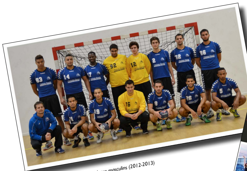
Équipe 1 plus de 16 ans masculins (2012-2013)

Au-delà de la compétition, l'US Métro c'est aussi une ambiance conviviale et festive, alors n'hésitez plus et venez tester!