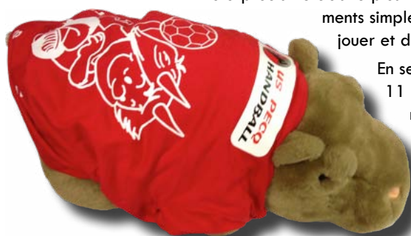
Hippopecq, la mascotte de l'USPHB

C'est pour l'état d'esprit et le fair-play que vous viendrez à l'US Pecq Handball, c'est pour tout ce que l'on partage tous ensemble des plus petits aux plus grands que vous resterez à l'US Pecq Handball