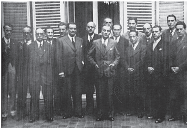
Le Conseil National de la Résistance à la Libération, sous la présidence de Georges Bidault

Le CNR fût créé le 27 mai 1943, pour répondre à la nécessité de coordonner les différents mouvements de la Résistance française. Ces hommes et ces femmes, et parmi eux un nombre important de communistes, étaient animés par 2 objectifs majeurs: retrouver la liberté qu'on leur avait volée 3 ans auparavant et préparer la France du lendemain, celle de l'espoir.