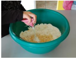
1 paquet de levure