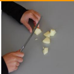
2 pommes 2 poires