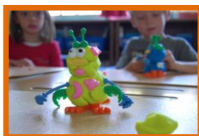
Le monstre en pâte à modeler préféré par la classe.