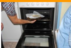
Mettre au four moyen 35 minutes