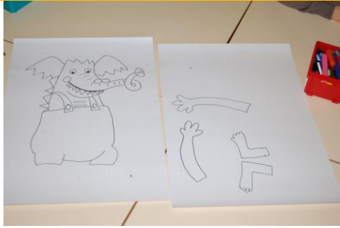
Prendre la photocopie