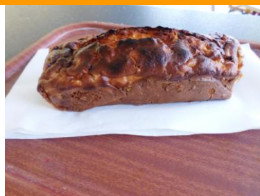
C'est bon !