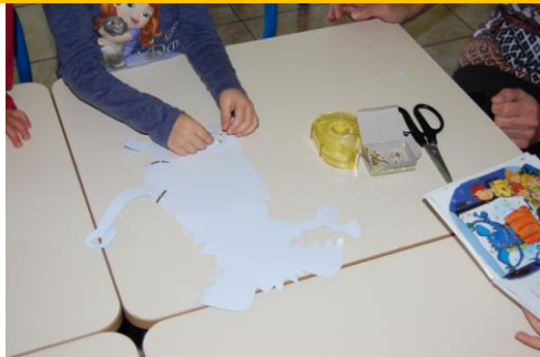
Mettre des attaches Parisienne