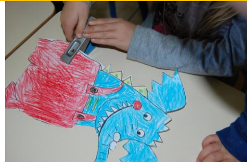
Faire des trous