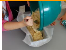
verser dans un moule