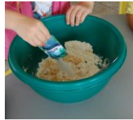
1 paquet de sucre vanillé