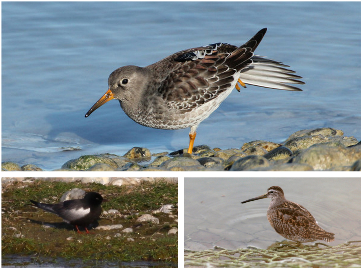
FIGURE 6 – En haut : Bécasseau violet - Le Hourdel-80 - novembre 2012 ; en bas à gauche : Guifette leucoptère - Cayeux-sur-mer-80 - mai 2013 ; en bas à droite : Bécassin à bec court - Le Crotoy-80 - novembre 2012