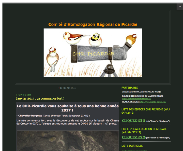
FIGURE 1 – Blog du CHR-Picardie.

La liste des espèces CHR mise à jour, la fiche vierge à remplir et les derniers rapports sont téléchargeables sur la page d'accueil du blog du CHR Picardie : http://chr-picardie.over-blog.com/ .