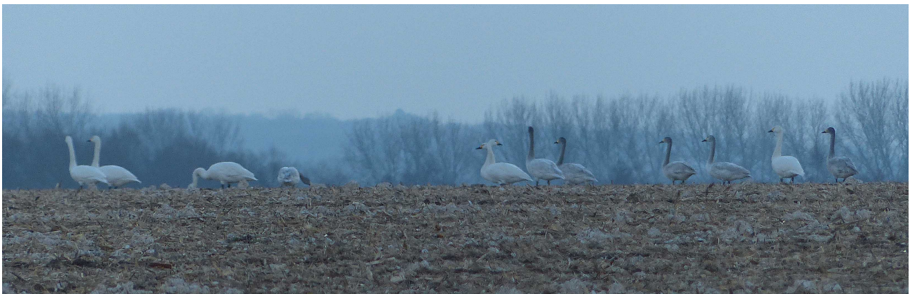
FIGURE 3 – Cygnes de Bewick - Ponthoile-80 - février 2013 - photo T. Rigaux

Pour optimiser la place, un certain nombre d'abréviations ont été utilisées ci-après : m - mâle ; f - femelle ; ad - adulte ; AX - oiseau de X-ième année civile ; imm - immature.