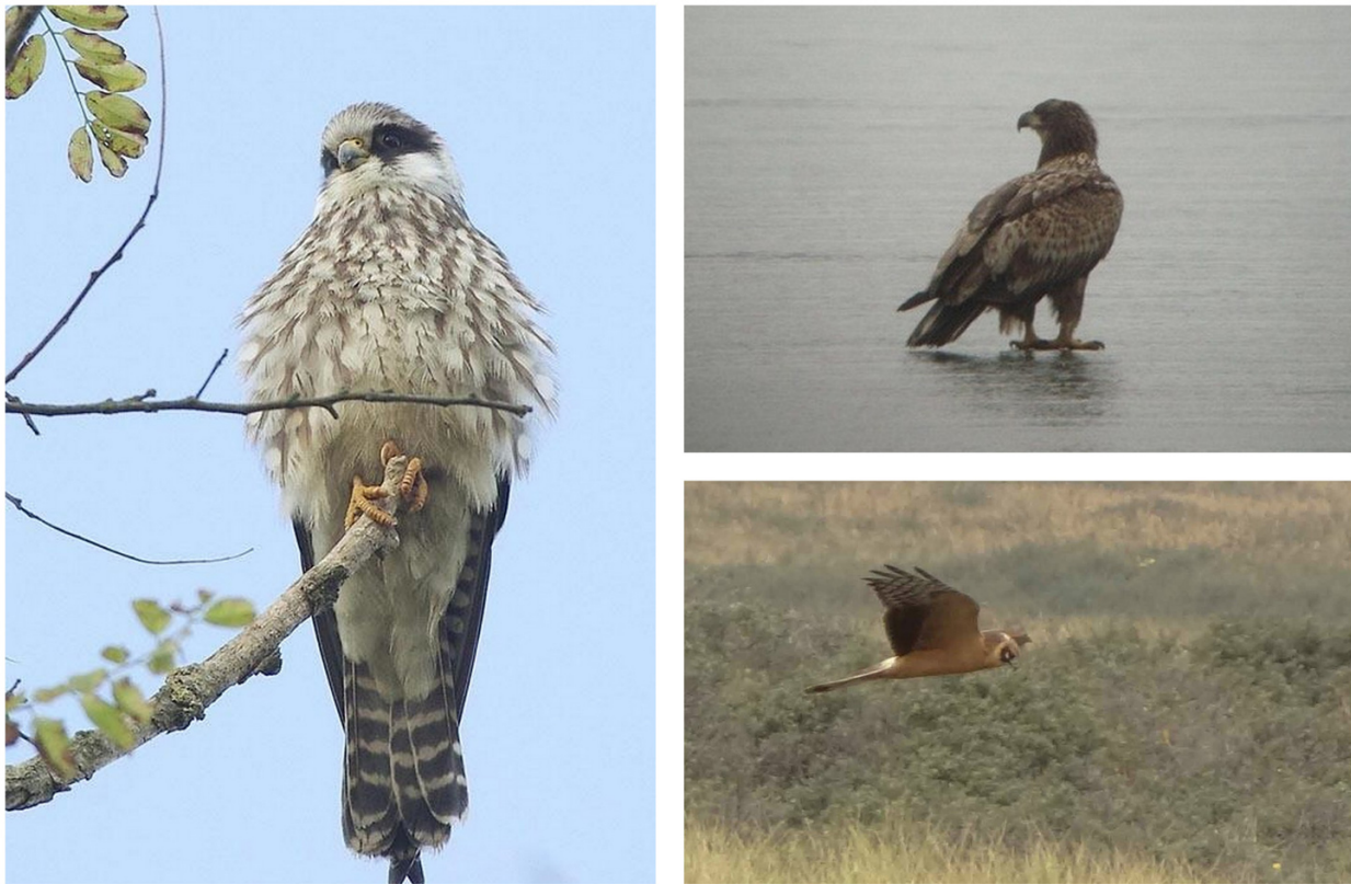
FIGURE 5 – A gauche : Faucon kobez - Brassoir-60 - octobre 2013 ; en haut à droite : Pygargue à queue blanche - Viry-Noueuil-02 - février 2012 ; en bas à droite : Busard pâle - Baie de Somme-80 - septembre 2013