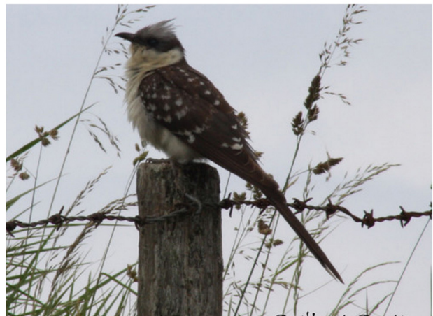
FIGURE 7 – En haut à gauche : Labbe à longue queue - Vecquemont-80 - septembre 2012 - photo T. Rigaux ; en bas à gauche : Goéland pontique - Boismont-80 - janvier 2013 - photo P. Dufour ; en haut à droite : Goéland à bec cerclé - Cayeux-sur-mer-80 - décembre 2012 - photo P. Bécue ; en bas à droite : Coucou geai - Fort-Mahon-80 - juin 2012 - photo G. Guibert