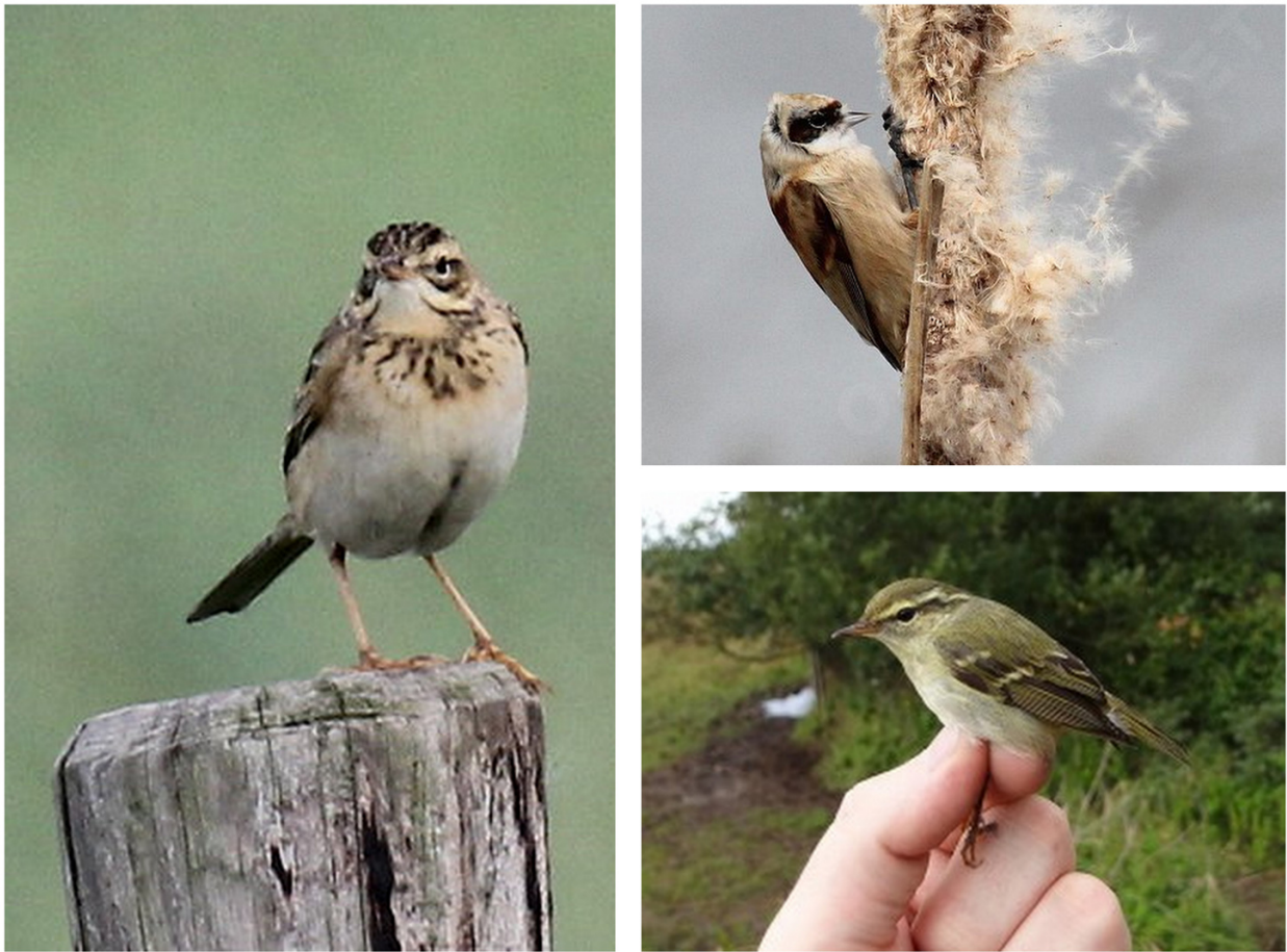
FIGURE 8 – A gauche : Pipit de Richard - Cayeux-sur-mer-80 - novembre 2013 - photo P. Bécue ; en haut à droite : Rémiz penduline - Le Crotoy-80 - novembre 2013 - photo P. Bécue ; en bas à droite : Pouillot à grands sourcils - Parc du Marquenterre-80 - septembre 2012 - photo A. Leprêtre