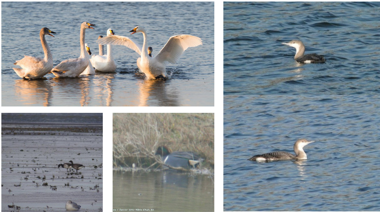
FIGURE 4 – En haut à gauche : Cygnés de Bewick - Parc du Marquenterre-80 - février 2013 ; à droite : Plongeon arctique - Monampteuil-02 - décembre 2013 ; en bas première à gauche : Bernache cravant à ventre pâle - Baie d'Authie-80 - novembre 2012 ; en bas seconde au milieu : Sarcelle à ailes vertes - Hâble d'Ault-80 - janvier 2012