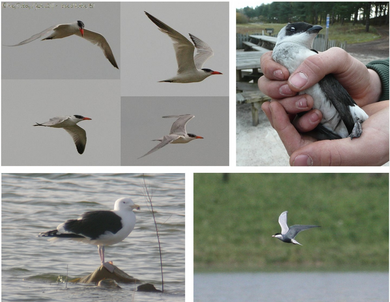
FIGURE 5 – En haut à gauche : Sterne caspienne - Baie d'Authie-80 - septembre 2011 - photo Y. Dubois ; en haut à droite : Mergule nain - Saint-Quentin-en-Tourmont - décembre 2011 - photo POM ; en bas à gauche : Goéland marin - Rivecourt-60 - mars 2011 - photo Y. Dubois ; en bas à droite : Guifette moustac - Limé-02 - avril 2011 - photo R. Le Courtois Nivart