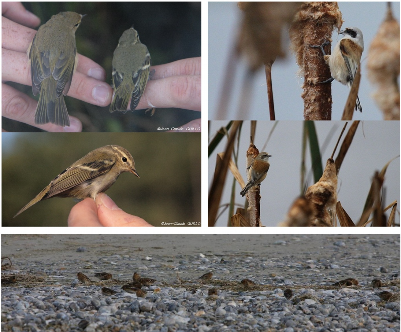
FIGURE 6 – En haut à gauche : Pouillot à grands sourcils avec un Pouillot véloce - Saint-Quentin-en-Tourmont - octobre 2011; en haut à droite : Rémiz penduline - Le Crotoy - novembre 2011; en bas : Linotte à bec jaune - Cayeux-sur-Mer-80 - janvier 2011