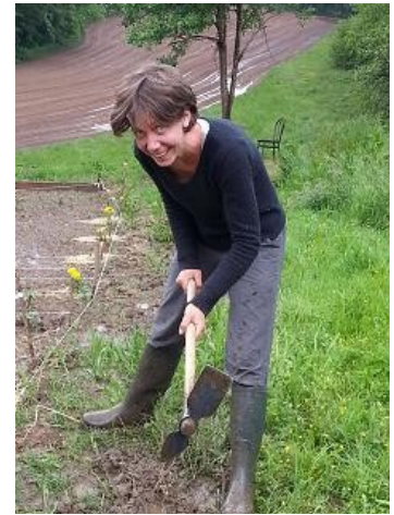
2 pattes palmées, tête poilue