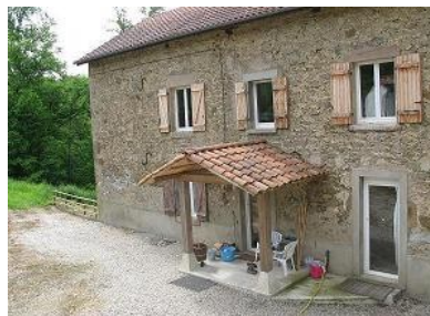
nid de pierres