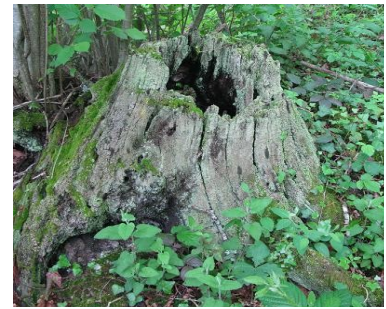
ou souche d'arbre ouvragée