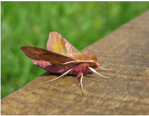
6 pattes, 2 paires d'ailes

Par contre, ils peuvent prendre différents aspects selon l'heure et la saison . En voici quelques spécimens, observés dans un lieu particulièrement favorable à la diversité :