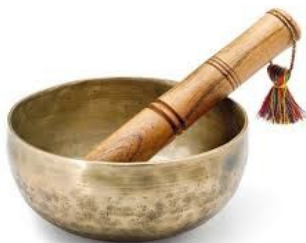
immobilisation brève au son d'une cloche