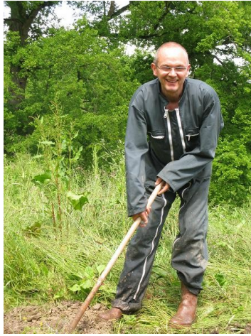
3 pattes, 2 yeux vitrés, tête nue