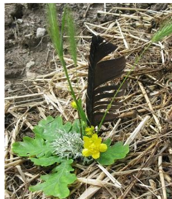
offrandes diverses à la Terre