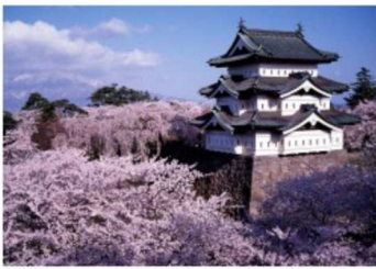
Le château de Hirosaki