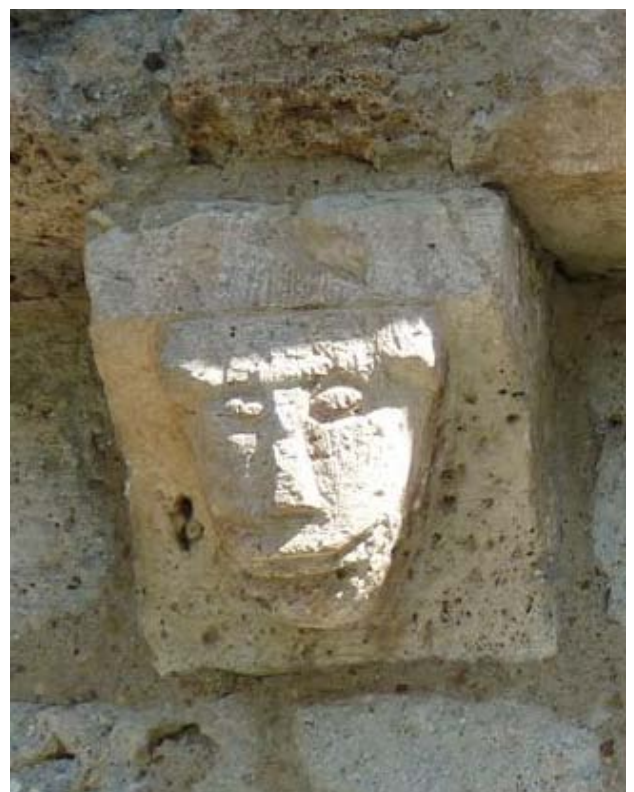
Détail de l'église d'Assouste du XII ème siècle.

1h45 5 710794 E - 4762818 N Au niveau d'une grosse maison à galerie, prendre à gauche un sentier entre des murets qui descend à travers champs. Jolie vue sur Béost. Au bout de 100m suivre à droite un chemin plus large qui rejoint le centre de Béost.