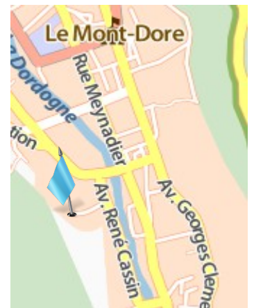
Localisation du départ

Se garer au parking du Funiculaire ou sur celui de la rue René Cassin.