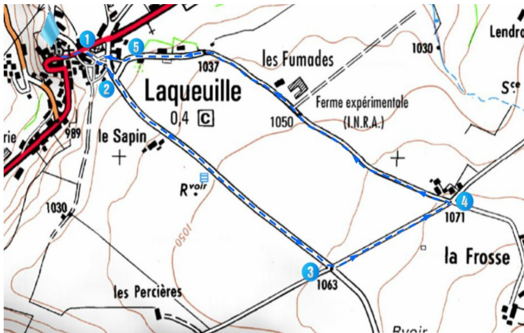
Carte de la randonnée