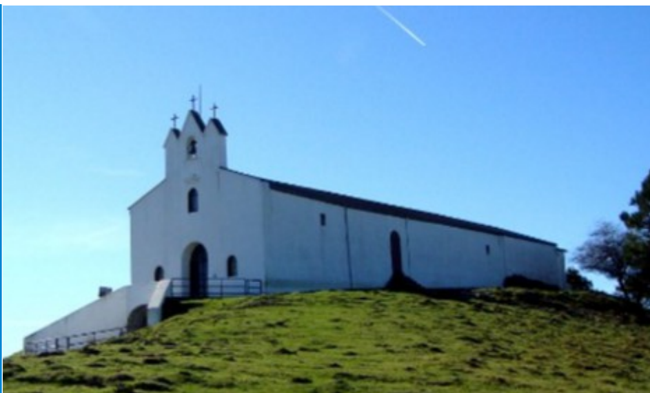
Chapelle Saint Antoine

Située sur la voie du Piémont, elle voit passer de nombreux pèlerins en direction de Compostelle.