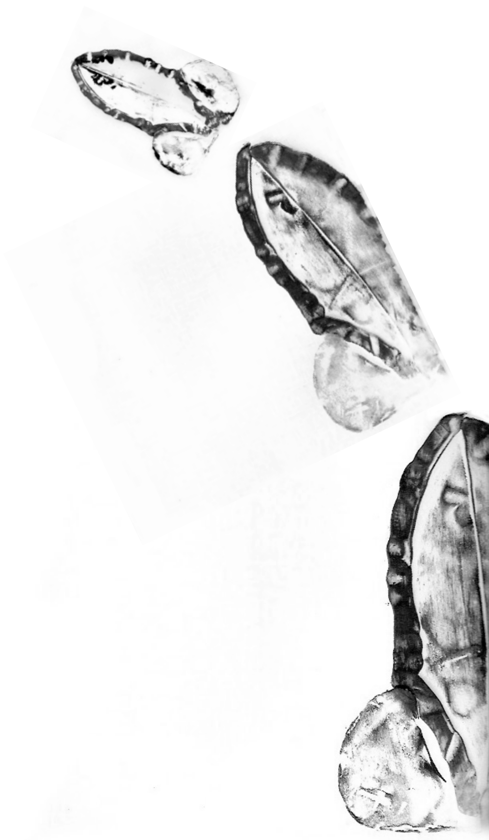
SERIE CONSTRUITE AUTOUR DES CLAIRS OBSCURS. SCANNER, GRAVURE ET PHOTO.