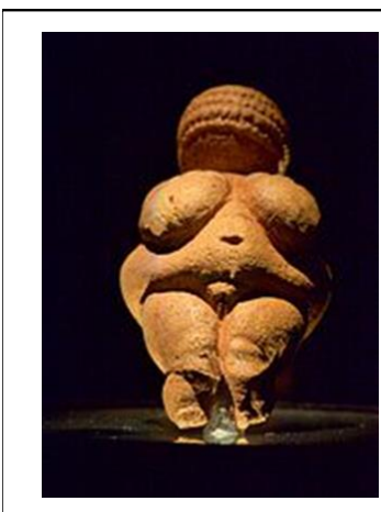
Les Vénus , statuettes