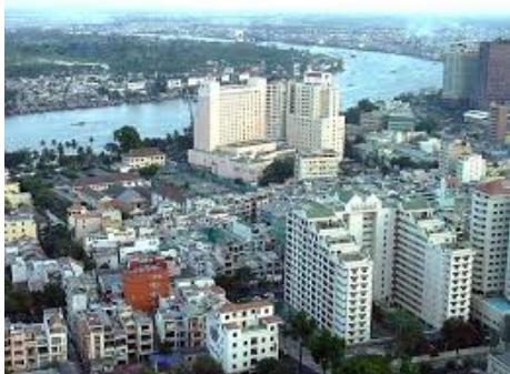
Ho Chi Minh Ville

Le pays a énormément développé la riziculture (le Vietnam est le 3 e pays qui exporte le plus de riz dans le Monde). L'agriculture y est très importante. Le tourisme y est en progression.