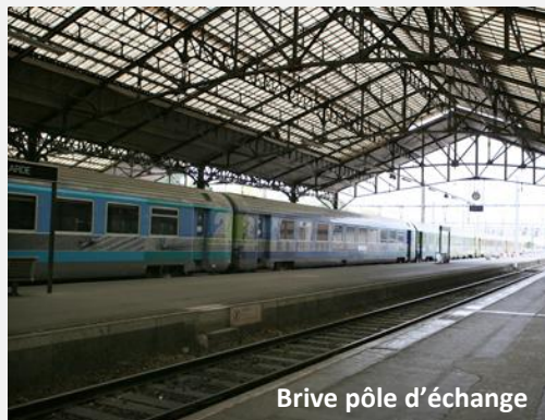
Brive pôle d'échange