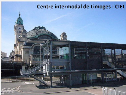
Centre intermodal de Limoges : CIEL

Les trains de nuit sont également une composante économique indispensable des services. Parallèlement à ce service pour les passagers, le fret doit voir ses gares accessibles pour ramener les chargeurs sur cet axe. Il est évident que POLT se dessine comme un axe de transit Fret mais il faut que les territoires traversés puissent également en bénéficier.