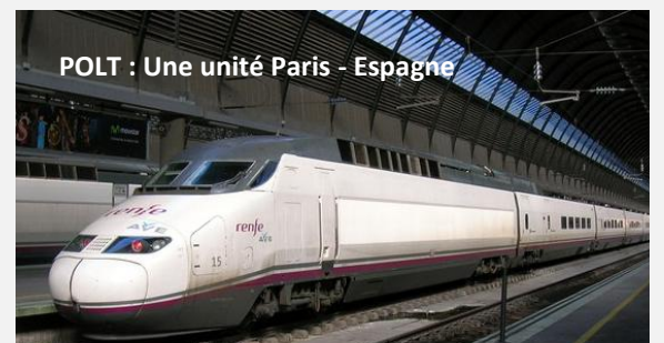
POLT : Une unité Paris - Espagne

Le TGV Brive - Lille démontre parfaitement la faisabilité d'une telle affectation. Ce type de matériels ouvre des perspectives d'interconnexion étendues pour le POLT en faisant renaître des continuations vers l'Espagne en partenariat avec RENFE au sud ou vers l'Allemagne avec DB, l'Angleterre et le Benelux au nord de POLT avec Thalys.