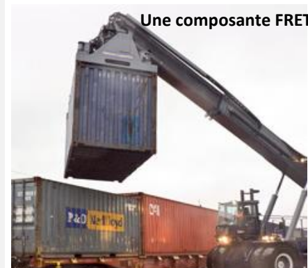
Une composante FRET

Au niveau des rames à introduire sur POLT, il ne s'agit que d'une décision de gestion de la SNCF.