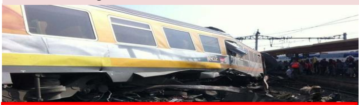
Conséquences graves des reports d'investissements POLT

Outre la dégradation des temps de parcours, l'épuisement des réserves de maintenances de la ligne POLT ont justifié des détournements de trafics fret par Bordeaux pour faire durer la voie sans investissements majeurs. Des services ont été dégradés pour persuader la clientèle de se reporter sur le TGV. Les trains de nuit par exemple ont vu la qualité de leurs services devenir complètement obsolètes. Le train hôtel Talgo Paris - Barcelone a été supprimé pour reporter la clientèle sur le TGV Méditerranée. Les trains TET ex-Teoz et Lunéa Paris - Port-Bou sont également en sursis.