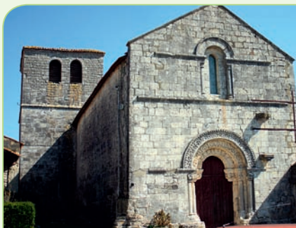
Les Églises-d'Argenteuil <