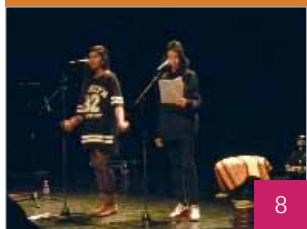
JOURNÉE DES COLLÉGIENS