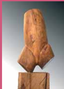
© Manuel Van Thienen, « Constantin revient de guerre », cerisier